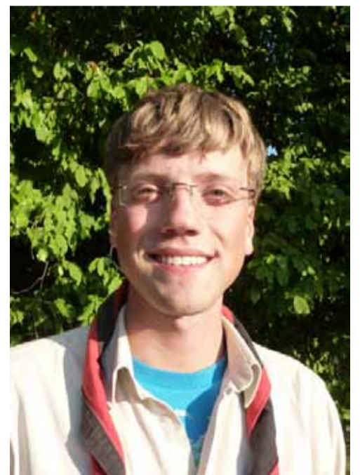
JO - BUNDESFÜHRER