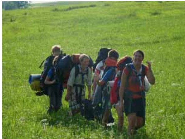
EINIGE DER GRUPPENLEITER AUF WANDERUNG

Als schließlich alle Gruppen fertig und erschöpft angekommen waren, dauerte es nicht