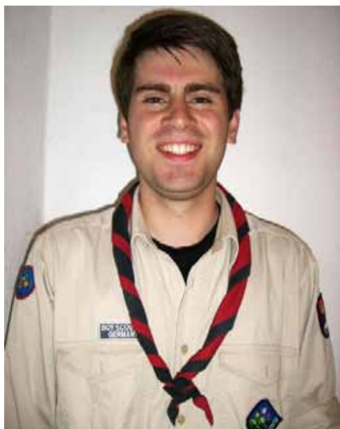
GRISU - STV. BUNDESFÜHRER

Sinnvolleres als eine gute Jugendarbeit. Mich motivieren meine Bundesführungskolegen und andere Gruppenleiter. Die große Gemeinschaft fand ich schon immer faszinierend, das gemeinsame Ziel für das Große Ganze ist eine starke Motivation. (Wer noch mehr wissen will darf sich gern mal beim Lagerfeuer neben mich setzen...)