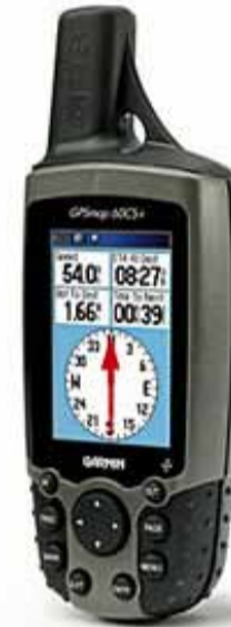
GARMIN GPS-GERÄT

Die Verwendung des NAVSTAR-GPS ist kostenlos, es fallen lediglich Kosten für die Anschaffung eines Navigationsgerätes an. Als Nachteil muss allerdings eingestuft werden, dass das Ganze durch das Militär betrieben wird. Eine Alternative wäre das Satellitensystem „Galileo“, das in Europa von zivilen Stellen unterhalten wird.