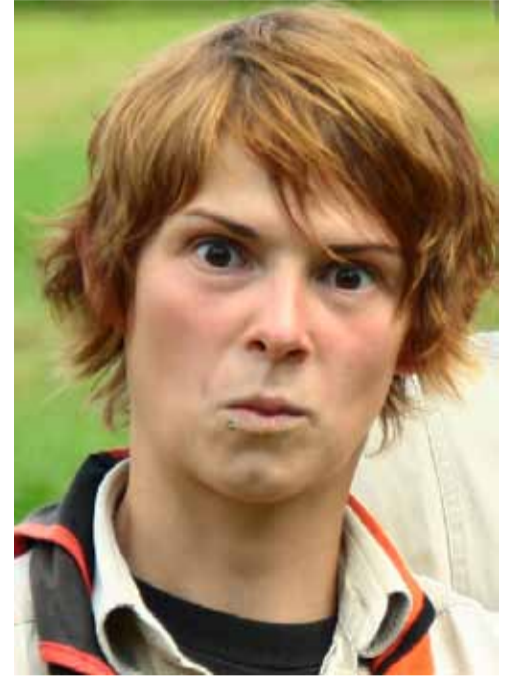
JASMIN - BUNDESKASSIERERIN

FRANZISKA Seit nun zwei Jahren studiere ich Sozialpädagogik und mache gerade ein Praktikum (gehört zum Studium). Sonst gehe